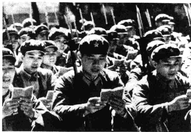
Partei und den Vorsitzenden Mao angreifen, verhetzt waren.

Doch auch wenn die Rotgardisten in ihrer absoluten Mehrheit ehrlich und anständig waren, Disziplin hielten und kaum Anlass zur Kritik boten, gab es unter ihnen auch schädliche Elemente. Das gravierendste Beispiel ist wohl die Lientung, eine Gruppe deren Führer aus Kindern verdienter Kader bestand die nicht nur extrem elitär waren, sondern auch über viele Kontakte, Material und insbesondere Geld verfügten. Die Rechte um Liu kontrollierte diese Gruppe und so griff diese ganz unverhohlen die Gruppe Kulturrevolution, besonders die Genossin Qiang Qing, an und bejubelte Liu. Zu Beginn des Jahres 1967 wurden viele von ihnen verhaftet und die Lientung als konterrevolutionär verurteilt.