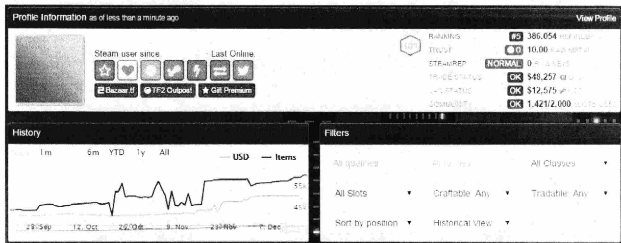
Dieser Team Fortress 2 Spieler besitzt Gegenstände im Wert von 48.275$, über 44.000€

geht bei einigen Spielen so weit, dass von Pay-to-Win gesprochen wird, Gegenstände, die eine Figur im Spiel anderen gegenüber ungleich stärker machen, was von Spielern, die kein Geld ausgeben entweder nur durch sehr langes Spielen oder gar nicht erreicht werden kann.