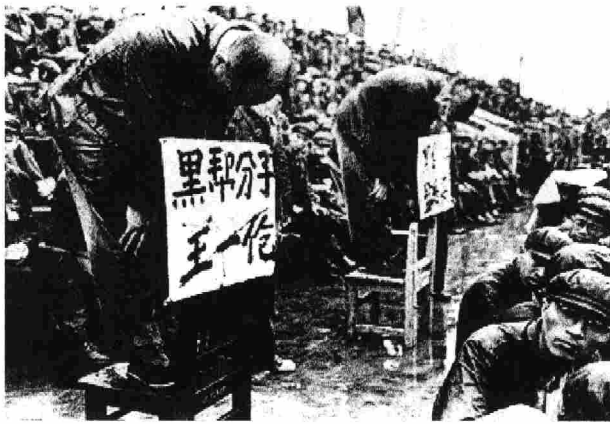
Reaktionäre werden von den Roten Garden bestraft

Die Reaktion stellte weitere Einheiten auf: 'Rote Armeen', 'Arbeiterarmeen', 'Bauernarmeen' oder 'Rote Garden'. Doch diese hielten die Kulturrevolution nicht auf. Im Herbst, genauer im Oktober 1966, wurde Liu aufgefordert Selbstkritik zu leisten.