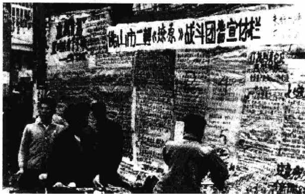
Wandzeitungen (dazibao): Ein häufig verwendetes Element im Kampf der Massen während der Kulturrevolution, das sich teilweise bis heute in den Straßen Chinas entdecken lässt.

Doch auch wenn die Rotgardisten in ihrer absoluten Mehrheit ehrlich und anständig waren, Disziplin hielten und kaum Anlass zur Kritik boten, gab es unter ihnen auch schädliche Elemente. Das gravierendste Beispiel ist wohl die Lientung, eine Gruppe deren Führer aus Kindern verdienter Kader bestand die nicht nur extrem elitär waren, sondern auch über viele Kontakte, Material und insbesondere Geld verfügten. Die Rechte um Liu kontrollierte diese Gruppe und so griff diese ganz unverhohlen die Gruppe Kulturrevolution, besonders die Genossin Qiang Qing, an und bejubelte Liu. Zu Beginn des Jahres 1967 wurden viele von ihnen verhaftet und die Lientung als konterrevolutionär verurteilt.