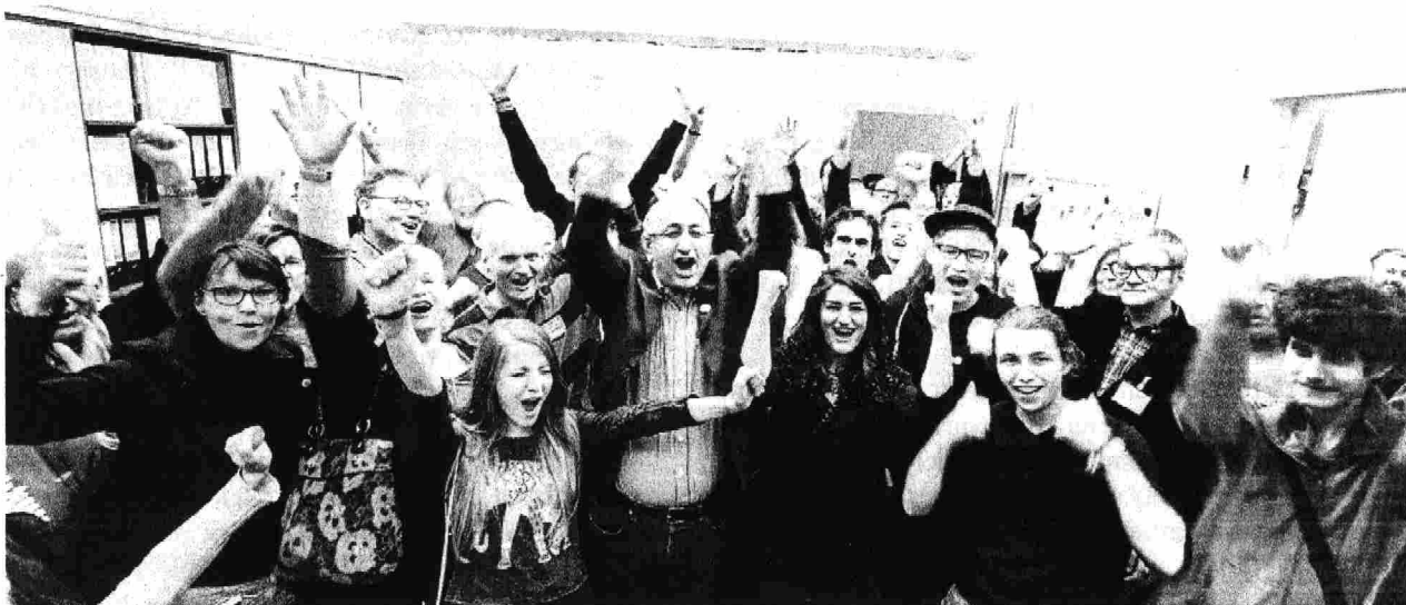
Nolympia am Ende

hieß diese Leute zu einem noch größeren Elend und noch mehr Tod zu verdammen. Und davon zu reden, dass durch die Ablehnung der Bewerbung ein Angriff der Kapitalisten auf die Hamburger Bevölkerung abgewehrt wurde, dient am Ende auch nur der Bourgeoisie.