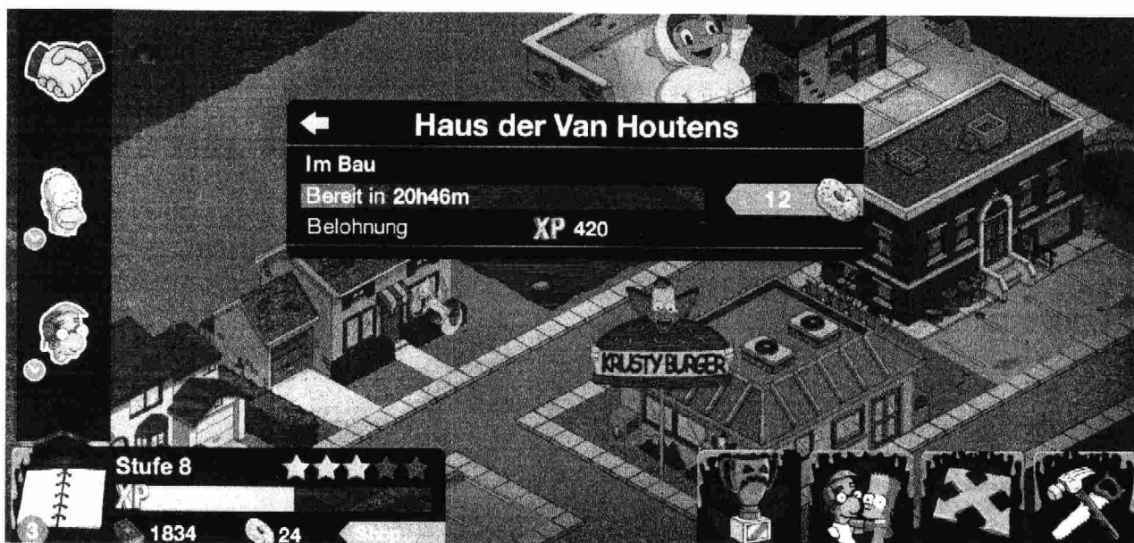
Typische Spielunterbrechung, die mit In-Spiel-Währung übersprungen werden kann.

Beispielsweise nehmen bei Apple Freemium-Apps über 92% des Umsatzes aller überhaupt angebotenen Apps ein, beim Konkurrenten Google sind es über 98%.