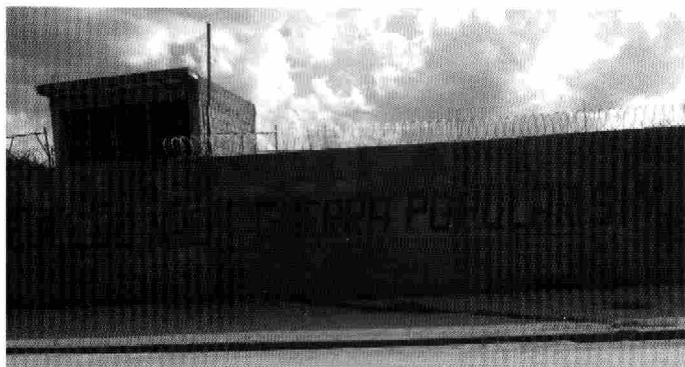
Wahlen, nein! Volkskrieg, ja!

Aber die gerechtfertigte Rebellion richtet sich nicht nur gegen Bolsonaro. Auch alle anderen Kandidaten und Parteien haben in den vergangenen Jahren bewiesen, dass es ihnen nur um ihre persönliche Macht geht. Sie haben bewiesen, dass das brasilianische Volk nichts von ihnen zu erwarten hat und auf den Demonstrationen, an denen sich überall im Land Zehntausende beteiligten, war auch eine viel grundsätzlichere Ablehnung der Wahlen der Bourgeoisie zu vernehmen. So beteiligten sich beispielsweise zahlreiche Revolutionäre an einer der Demonstrationen in Rio de Janeiro und trugen ein Transparent mit der Parole „Weder Wahlen noch Militärintervention, Revolution jetzt!“. Im ganzen Land fand eine große Kampagne statt, die zum Boykott der Wahlen aufrief. In den Städten und auf dem Land waren die Parolen zu lesen, die die bürgerlichen Wahlen als eine Farce denunzierten und dazu aufriefen zu kämpfen.