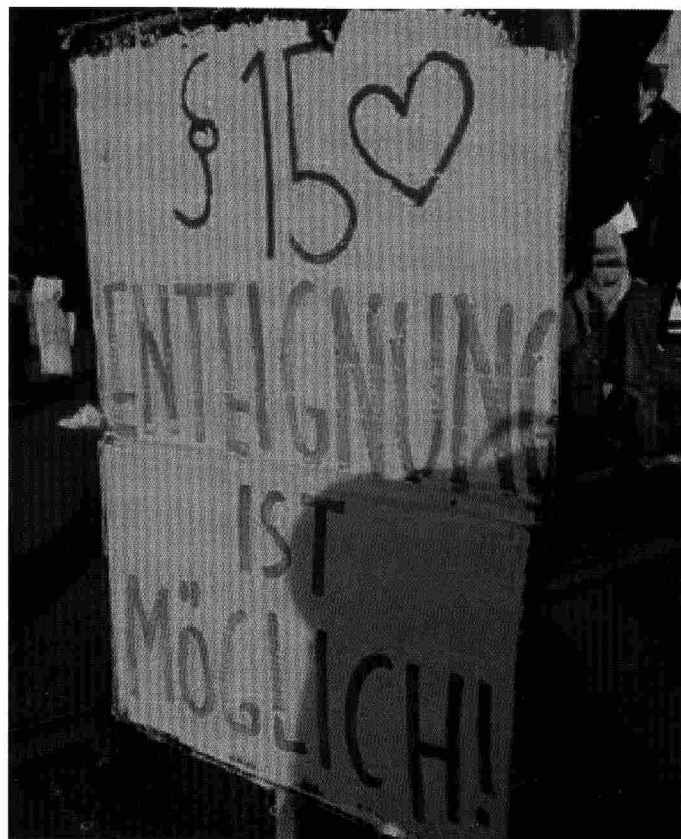
Aktion der Volksbegehren Initiative

Wir brauchen aber keine keine Bewegung, die sich an den Staat anbietet und ihm gegenüber als Bittsteller auftritt. Alle Illusionen in das System müssen beständig entlarvt werden. Darum ist die einzige richtige Haltung zu Volksbegehren: Ausbeutung abwählen das klappt nie, Boykott den Wahlen der Bourgeoisie! •