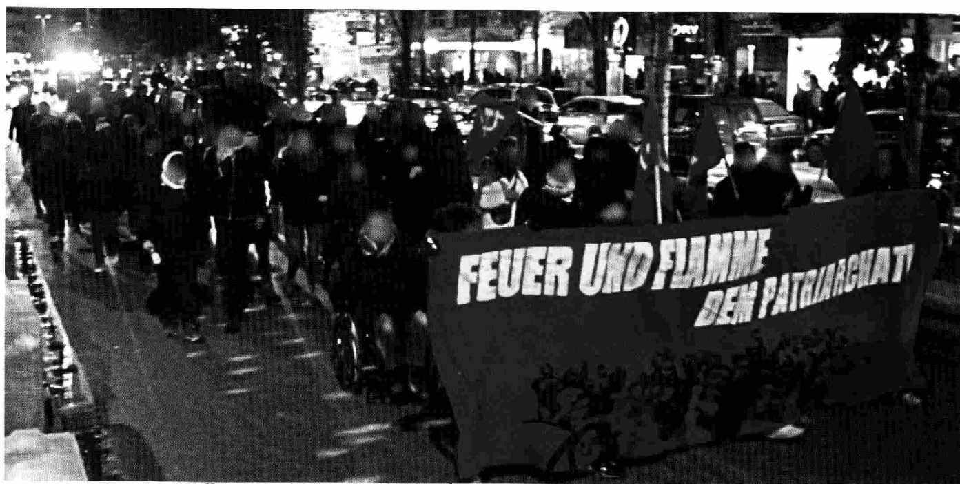
Demonstration vom Roten Frauenkomitee am 25. November 2017 in Hamburg

Kommt am 25. November nach Hamburg zur Demonstration um 16:30 Uhr, Lindenplatz, Nähe U-Bahn Berliner Tor•