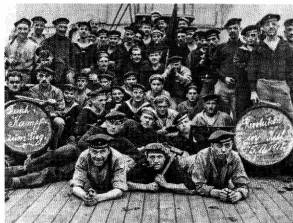
Kieler Matrosen: Durch Kampf zum Sieg

auch die USPD und der Spartakusbund besonders stark und forderten die sozialistische Revolution. In anderen Städten, in denen die Räte stärker unter dem Einfluss der SPD standen, wurde versucht die Imperialisten, die den ersten Weltkrieg zu verantworten hatten mit den Arbeitern und Soldaten, die dafür zu sterben hatten, zu versöhnen.