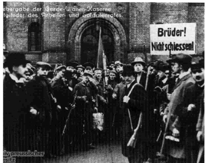
Übergabe einer Kaserne an den Arbeiter- und Soldatenrat

auch eine harte Lehrstunde für die Arbeiterklasse. Der Moment war günstig, aber was fehlte war die Führung in Form einer revolutionäre Kampfpartei, eine Partei neuen Typs, die in der Lage gewesen wäre dem Kampf Festigkeit und Bestand zu geben. Das bedeutet einer Kommunistischen Partei, die fest und unter den tiefsten und breitesten Massen verankert und auf alles vorbereitet ist. Diese Erfahrung der Novemberrevolution müssen die proletarischen Revolutionäre und die Arbeiterklasse in Deutschland heute verinnerlichen, damit sie den gleichen Fehler wie vor 100 Jahren nicht noch einmal begehen. Darum muss alle Arbeit die sie heute leisten dem Ziel dienen die Kommunistische Partei Deutschlands zu rekonstituieren. •