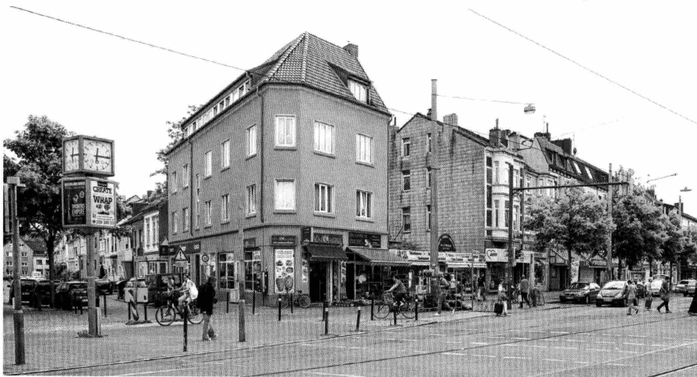
Die Kreuzung Gröpelingen Heerstraße/Lindenhofstraße vor einiger Zeit